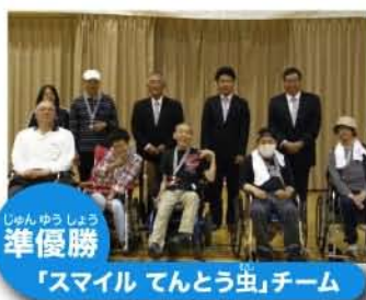
準優勝 「スマイル てんとう虫」チーム