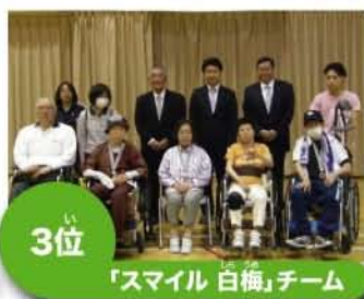
3位 「スマイル 白梅」チーム