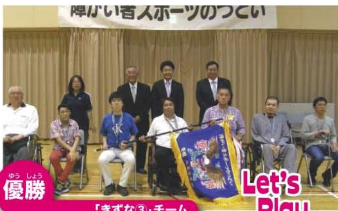
優勝 「きずな③」チーム