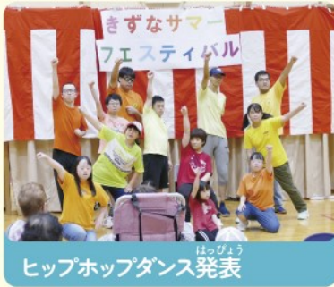
ヒップホップダンス発表