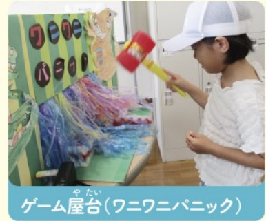
ゲーム屋台(ワニワニパニック)

「おさんぽ絵本」とは、大阪市平野区からスタートした絵本専用のまちかど図書館です。「おさんぽ絵本」のステッカーが貼ってあるお店なら、好きな場所で借りて、好きな場所に返せます