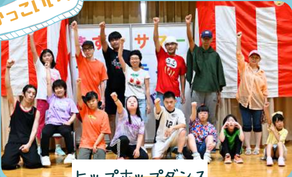
ヒップホップダンス