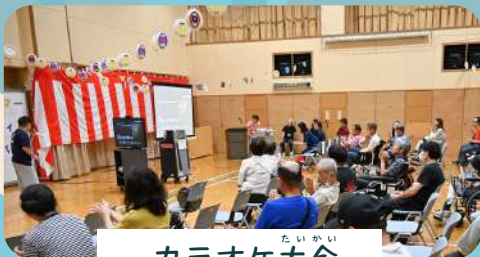
たいかい カラオケ大会