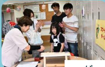
げーむ ゲーム屋台

オープニングセレモニーでは、車いすダンスサークル JAPANさんによる車いすダンスと、 福笑いさんによる南京玉すだれの発表が行われました。 今年にはカラオケ大会の開催もあり、大盛り上がり！ 最後は、ヒップホップダンスの発表♪ テンポの速い曲にノリノリでした！ 館内では、軽食販売・ゲーム屋台もあり お祭り気分を味わいました！