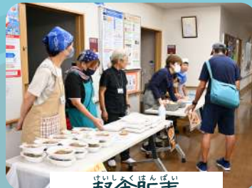
けいしょくはんばい 軽食販売