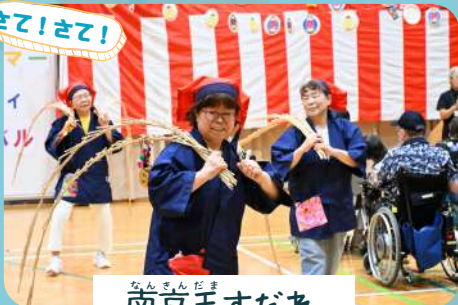
なんきんだま 南京玉すだれ